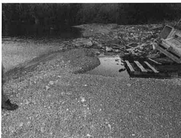
Utløpet av Gunhildrud er helt ødelagt.

Kostnader til dette er beregnet til kr. 25 000,-