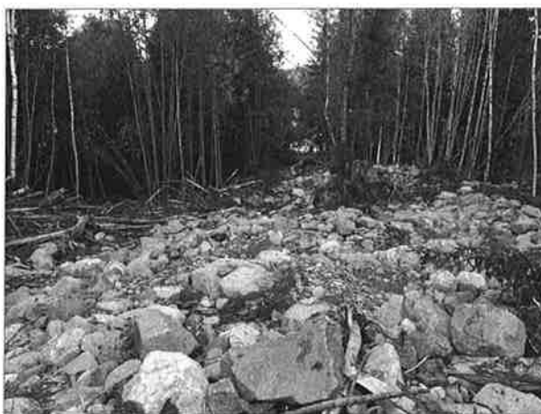
Her var det en gang en elv.

Beregninger og utredninger på arbeidet vil føre til en utgift på Kr. 35 000,-.