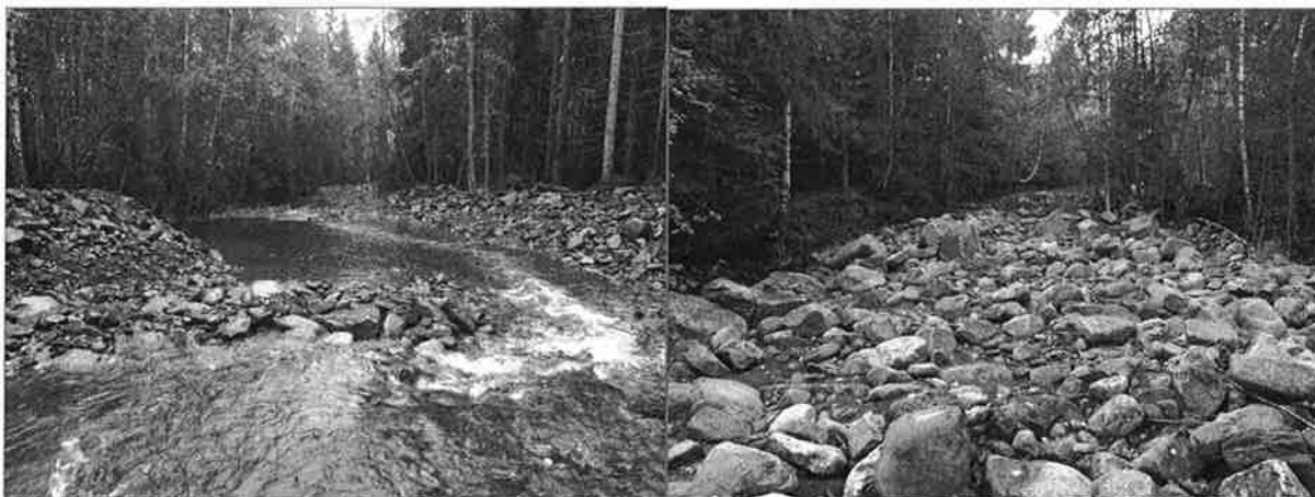
Bekken er gjenoppbygd igjen.

Her har foreningen kjøpt tjenester fra en maskinfører og vi har hatt en utgift pålydende kr. 21 718,50,- til denne jobben.